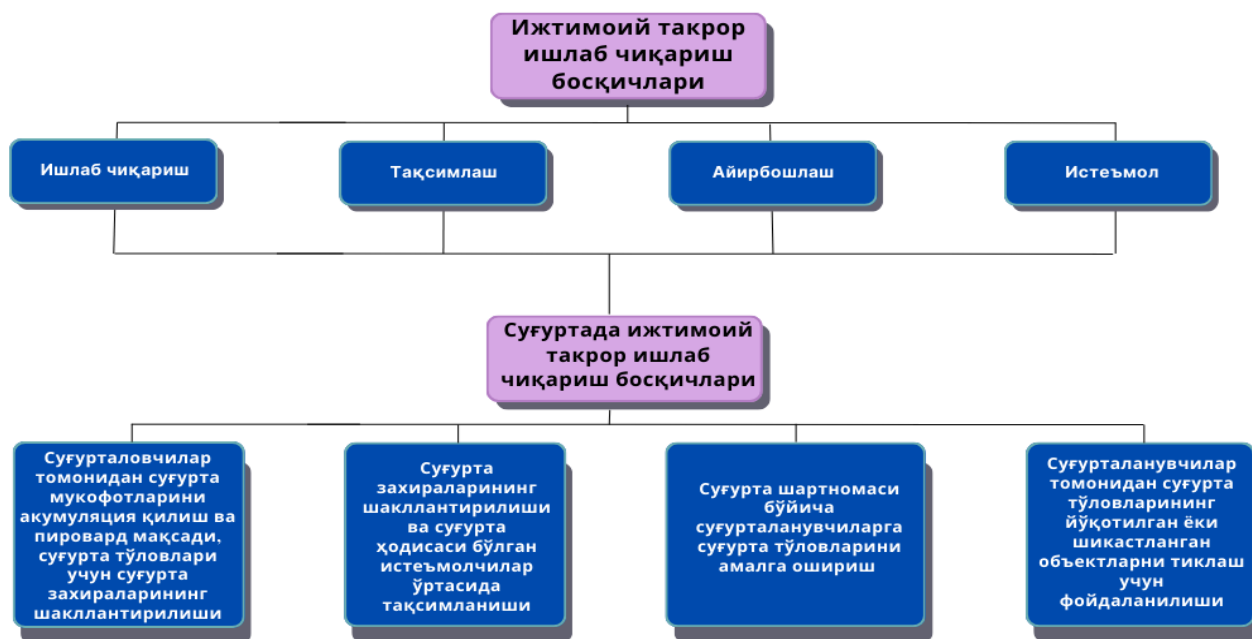
2-rasm. Ijtimoiy takror ishlab chiqarish jarayonida sug'urta faoliyatining shakllanishi 7

O'z navbatida, sug'urta zaxiralarining real manbalari va ishlab chiqarish egalari daromadlari fondi uchinchi bosqichda, ya'ni ayirboshlash bosqichida shakllanadi. Ayirboshlash bosqichida mulkdorlarning daromadlaridan qayta taqsimlash orqali ikkilamchi daromadlar yaratiladi, shu sababli ushbu bosqich qayta taqsimlash bosqichi deb ataladi. Sug'urtaning takror ishlab chiqarish tizimidagi roli va o'рни 2-rasmda tasvirlangan.